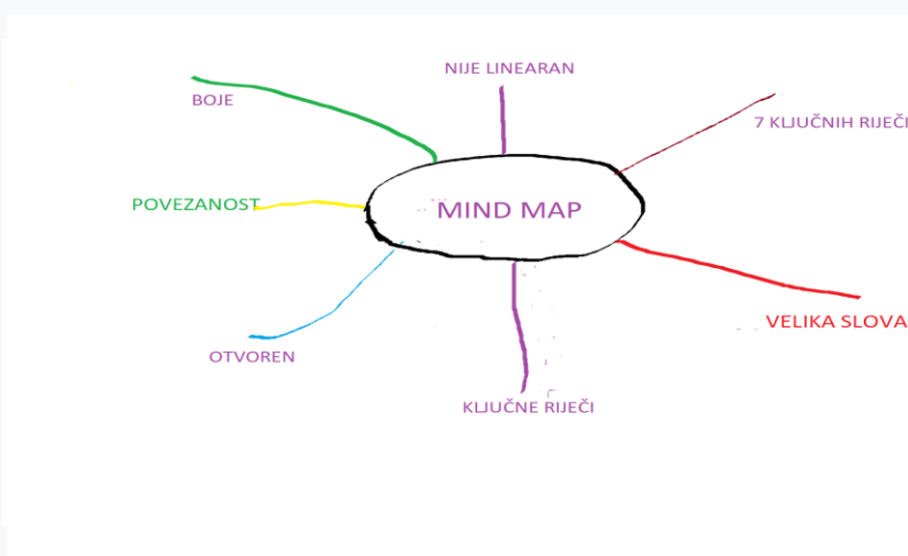
Slika 20 Miselni vzorec o miselnih vzorcih

Tehnika je preprosta. Izberemo temo, o kateri želimo pisati, govoriti ali se učiti. Na sredino postavite ime teme in ga obkrožite (slika 20). Nato z velikimi tiskanimi črkami zapišemo ključne besede, povezane z izbrano temo. Ključne besede so običajno samostalniki in pridevniki, ne glagoli. Majhni otroci se izražajo s ključnimi besedami, ker imajo skromen besedni zaklad. Tipičen primer tega izraza je izjava, kot je: »Lačen sem.« Otrok ne reče: »Lačen sem kot volk« ali »Imam hormone lakote«, ampak »Lačen sem. "da vemo, kdo je lačen in kaj hoče. Ključne besede pišemo z velikimi tiskanimi črkami, da jih lažje beremo. Pobarvajmo jih, da dobimo vizualne učinke.